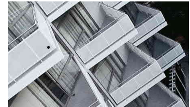
Balkonsanierung einer Hotelanlage

Mit Chips-Einstreuung, ColorQuarz-Abstreuerung oder einer glatt gespachtelten ColorQuarz-Mischung gestalten wir Ihren Balkon ganz individuell. Auch Designs mit Fugenoptik sind möglich. Damit Sie lange einen Platz in der Sonne haben!