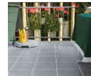
Beschichtung mit Fugenoptik

Damit die Substanz und der Erholungswert Ihres Balkons für viele Jahre Bestand haben, sollten das vorhandene Mauerwerk, Holz und Beton mit einer soliden Abdichtung vor Nässe, Wasser und Witterung geschützt werden. Wir schaffen eine dichte Schutzwanne, die alle empfindlichen Punkte Ihres Balkons umfasst und sorgen dafür, dass das Wasser perfekt abfließt. So schützen Sie Ihren Balkon und die angrenzenden Gebäudeflächen dauerhaft und zuverlässig vor Schäden.