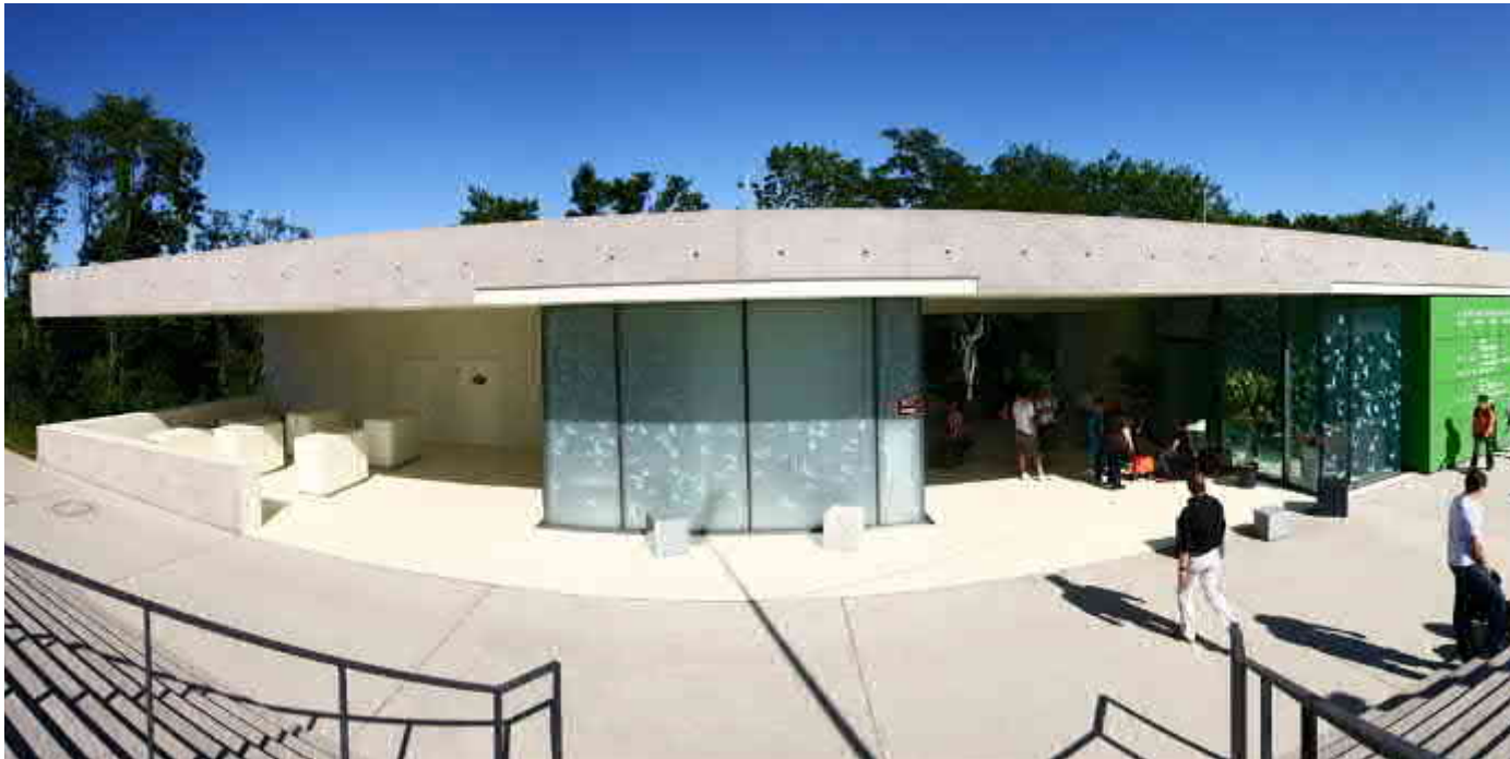
Pavillon Bundesgartenschau Koblenz 2011

Wir zeigen Ihnen die unendlichen Möglichkeiten und finden mit Ihnen zusammen den Fußboden, der zu Ihnen passt. Mit oder ohne Muster und genau in der Farbe, die Sie sich vorstellen. Rutschhemmend oder glatt, immer fugenlos und einfach zu reinigen. Immer langlebig und widerstandsfähig.