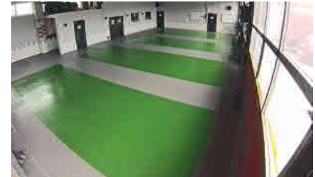
Parkfläche Feuerwehr Neuwied

Vor allem in Küchen oder der lebensmittelverarbeitenden Industrie ist Hygiene eine der größten Herausforderungen an Fußböden und bedeutet zugleich, dass die Beschichtung eine Menge aushalten muss. Häufiges Reinigen und aggressive Desinfektionsmittel dürfen die Struktur des Bodens nicht angreifen. Zugleich muss die Reinigung leicht von der Hand gehen. Dabei helfen glatte Oberflächen, Hohlkehlen in den Ecken, ein Gefälle zum Abfluss und wenig Fugen. Und natürlich das beste Material für die Beschichtung. Wir wissen worauf es ankommt. Fragen Sie uns!