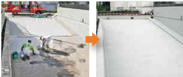
Epoxidharz-Beschichtung einer Tiefgaragenabfahrt (OS 8)

Kaufhaus, Industriegebäude, Ladenlokal oder Privaträume: Wir kennen den perfekten Boden für jede Herausforderung und für jede mögliche Belastung. Als 1-K-Anstrich oder 2-K-Beschichtung – Bodenbeschichtungen von Moseler bieten dauerhaften, widerstandsfähigen Schutz in jeder Situation. Fragen Sie uns und wir sagen, worauf Sie am besten stehen.