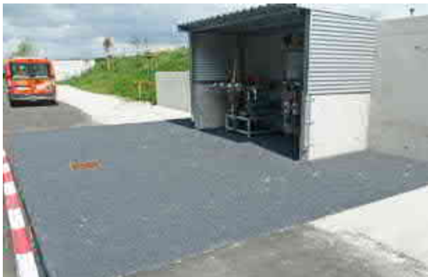
Gewässerschutzbeschichtung einer Lösemittel-Tankstelle

Wenn wir Langlebigkeit sagen, wissen wir, wovon wir sprechen. Unser Betrieb besteht seit 1888 und ist bereits in der sechsten Generation im Familienbesitz. Was wir tun, haben wir von der Pike auf gelernt. Und machen es mit Leidenschaft sowie der Erfahrung aus über 125 Jahren Handwerk und Sachverstand. Verlassen Sie sich darauf.